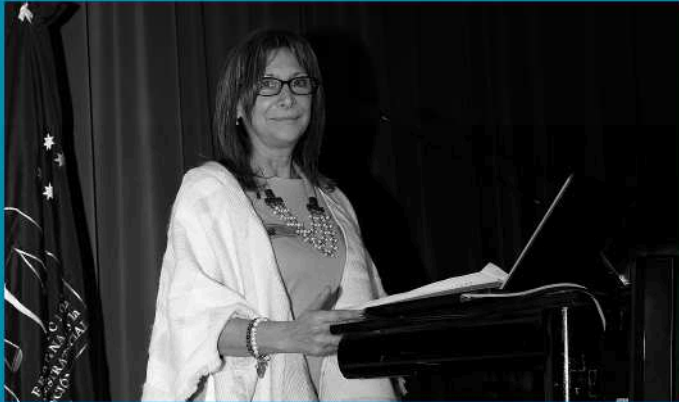
DRA. MARCELA DE LUCA Defensora General de Cámaras, Distrito Judicial N° 2, Rosario.